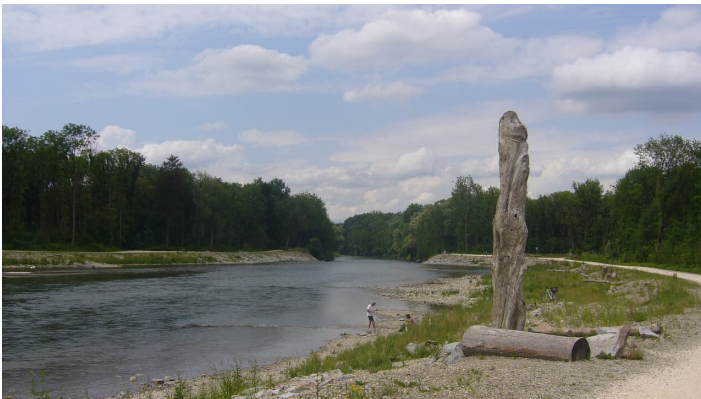
Rastplatz an der Iller, Illerzell