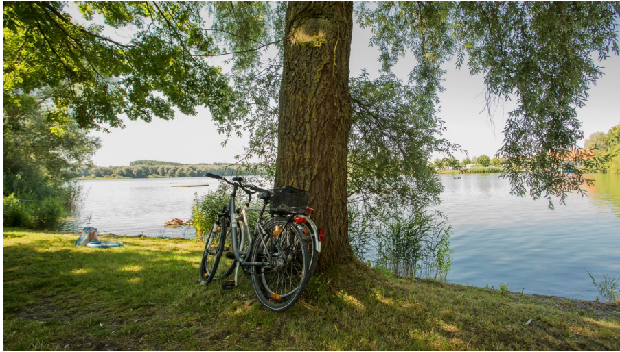
Oberrieder Badeseen