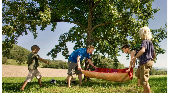
Familienpicknick am Donautäler