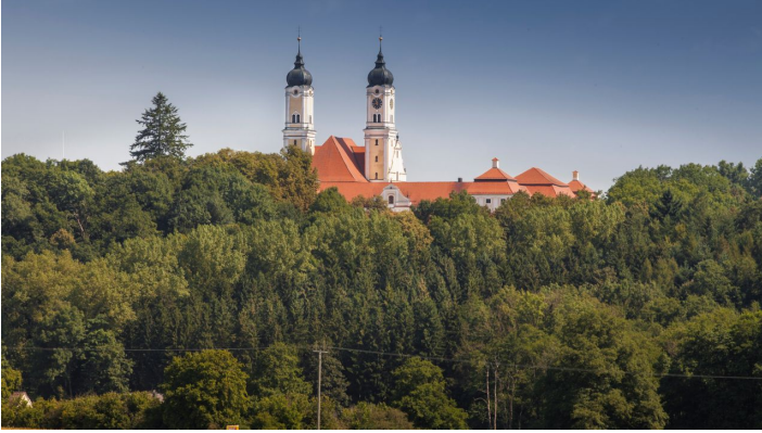
Blick auf Kloster Roggenburg