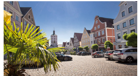
Lauschtour Günzburg - © Fouad Vollmer