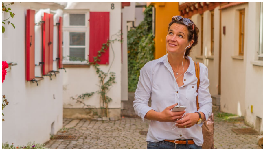
Lauschtour "Günzburger Stadtrundgang"