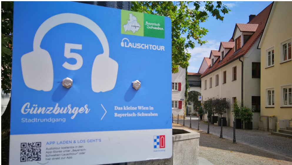
Lauschtour "Günzburger Stadtrundgang"