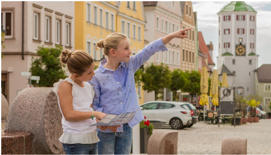
Stadtrallye - "Junge Entdecker unterwegs"