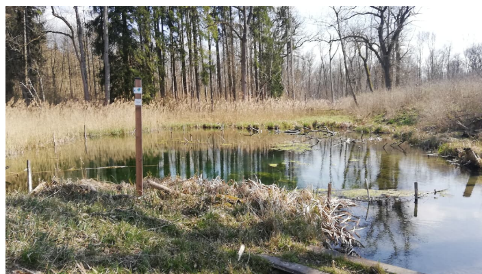
Altarm nach Offingen