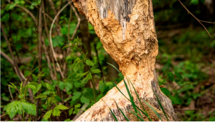
Biberspuren im DonAUwald