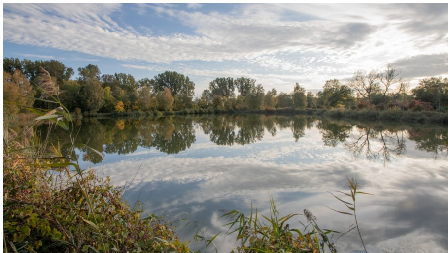
Bruckmahdseen bei Schwenningen