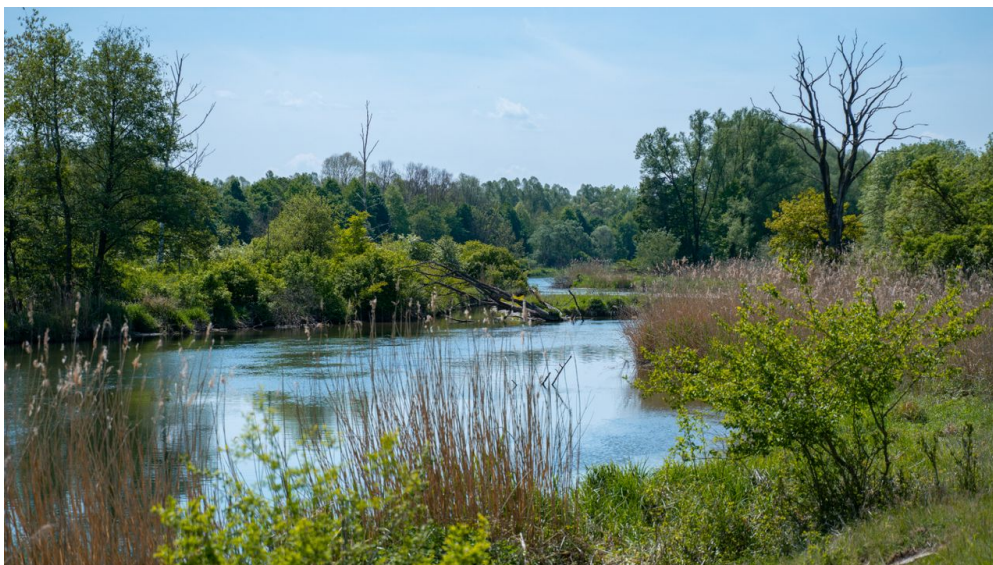
Natur pur im DonAUwald