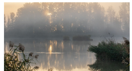
Donau bei Gremheim im Nebel