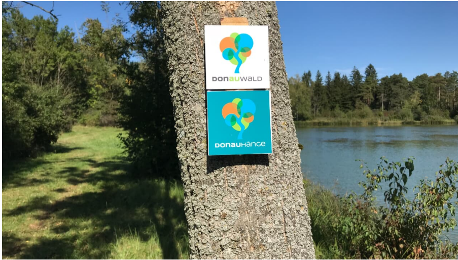
Beschilderung DonauHänge - © Manuel Andrack