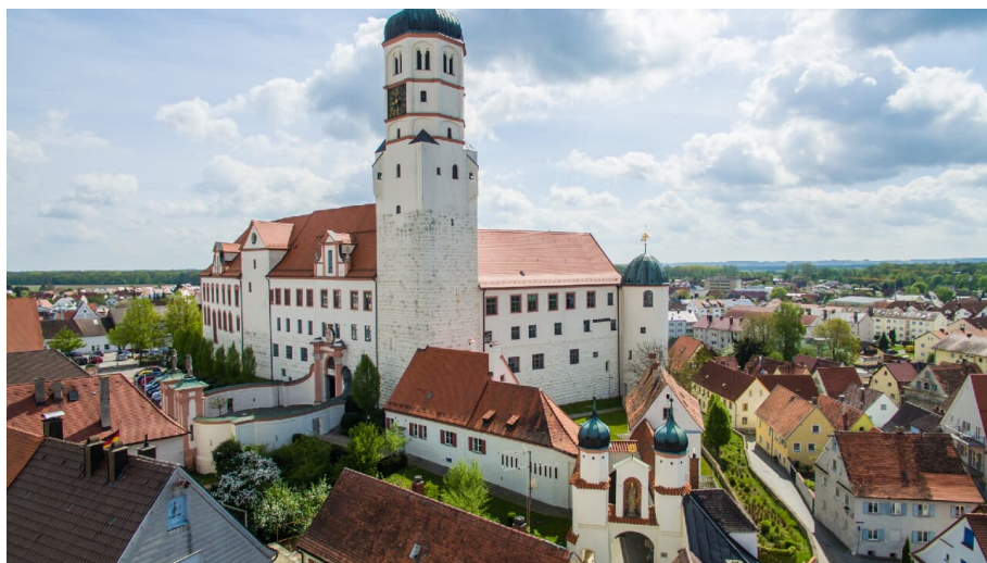
Schloss Dillingen - © Jan Koenen (Stadt Dillingen)