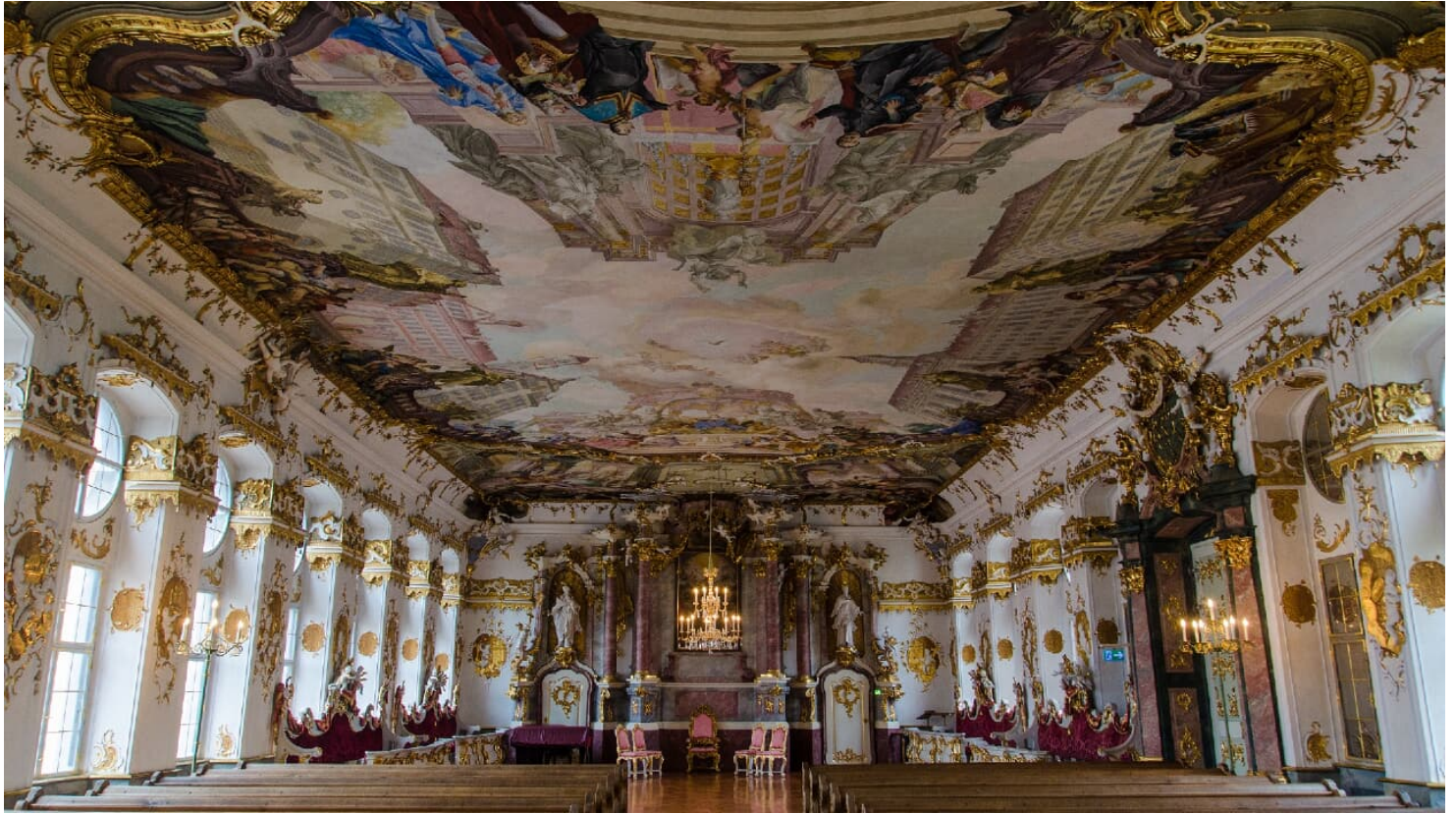
Goldener Saal Dillingen