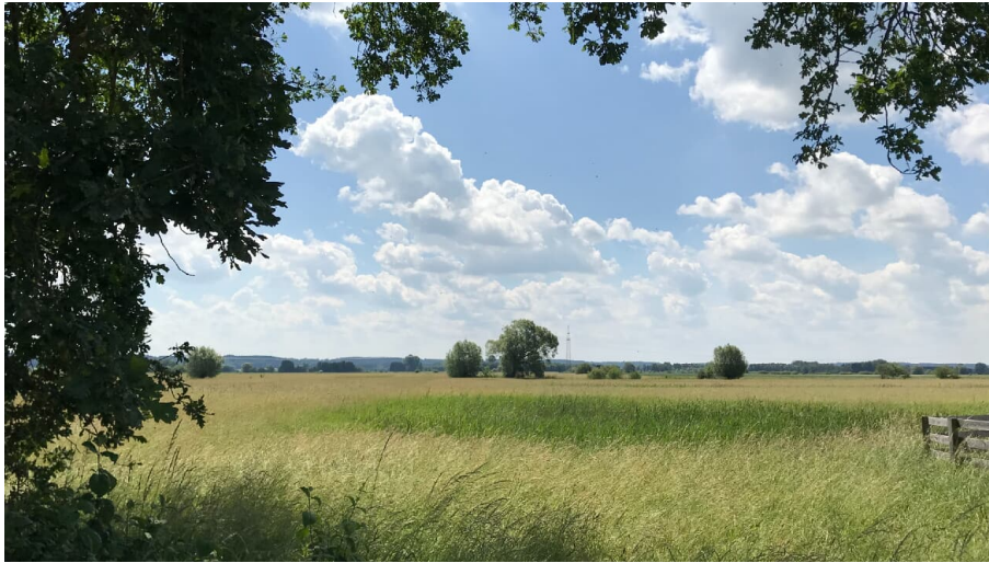
Donauried - © Andrea Zangl