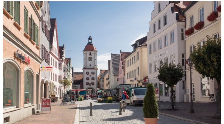
Altstadt Dillingen