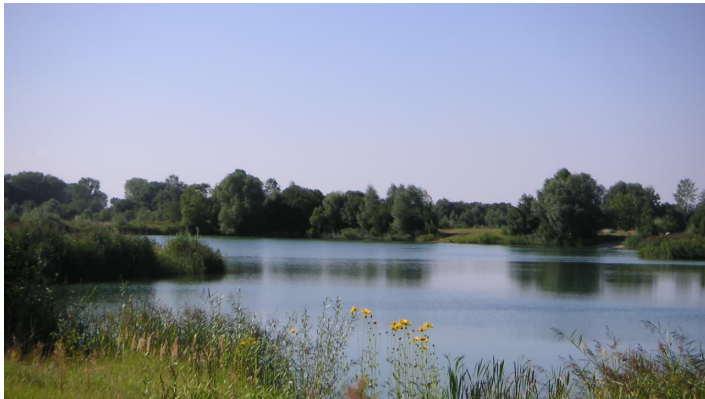
Weisinger Badeseen