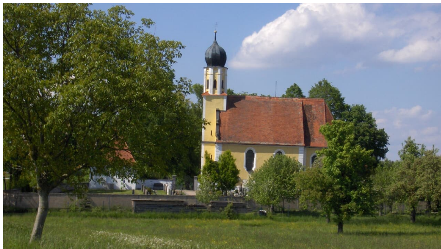
Kapelle St. Anna Amerdingen