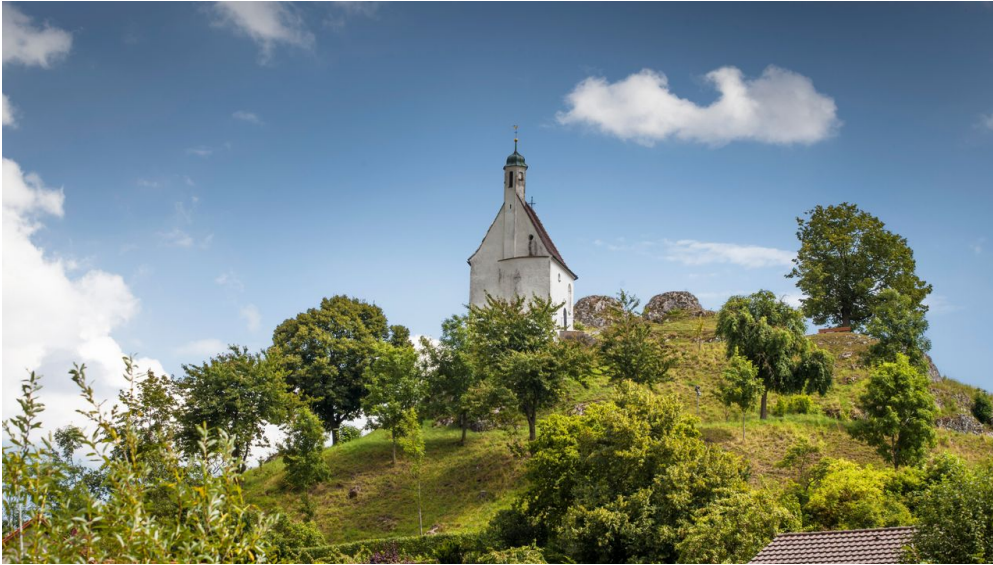
Blick auf die Kapelle bei Hochstein