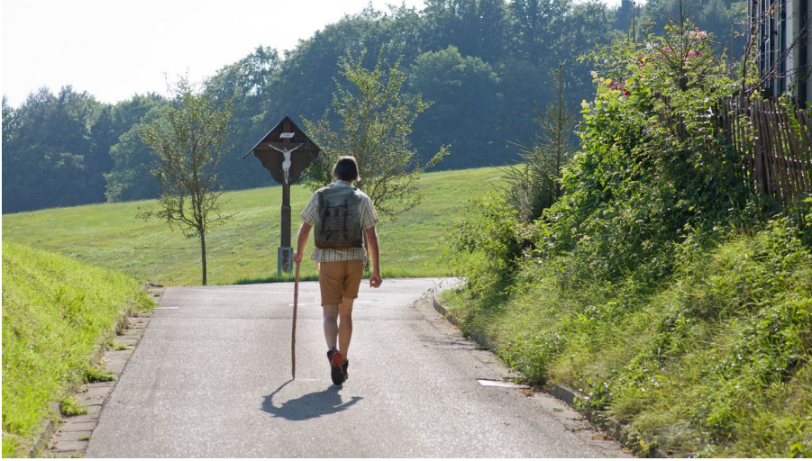
Unterwegs auf dem Panoramaweg Kesseltal NaTour