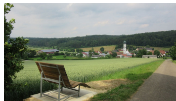
Panoramaliege mit Blick auf Buggenhofen