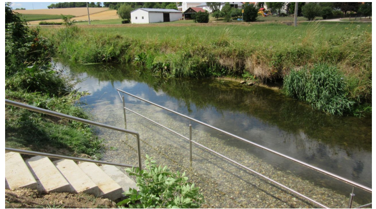
Naturkneippanlage bei Kesselostheim