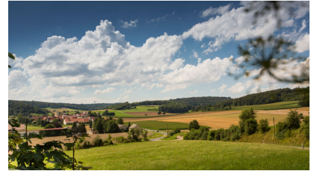
Panoramablick am Weg - © Fouad Vollmer