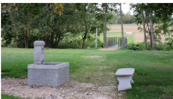
Trinkbrunnen mit Steg bei der Bissinger Auerquelle