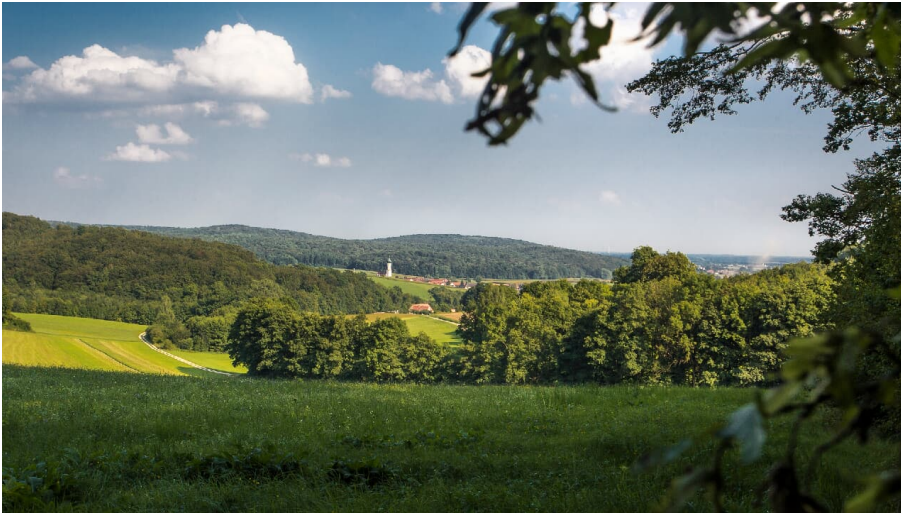
Blick auf Unterliezheim