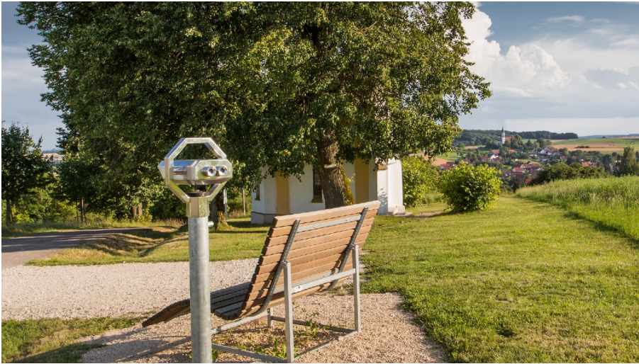
Panoramaliege bei Staufen