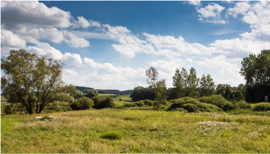
Dattenhauser Ried