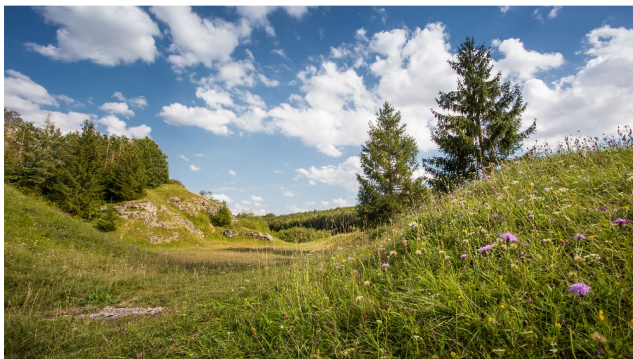
Pfannental - © Fouad Vollmer