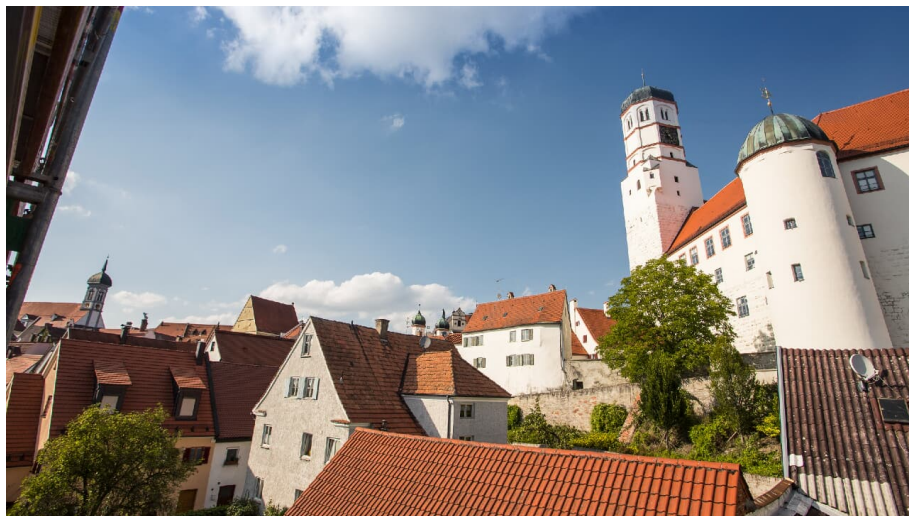
Schloss Dillingen