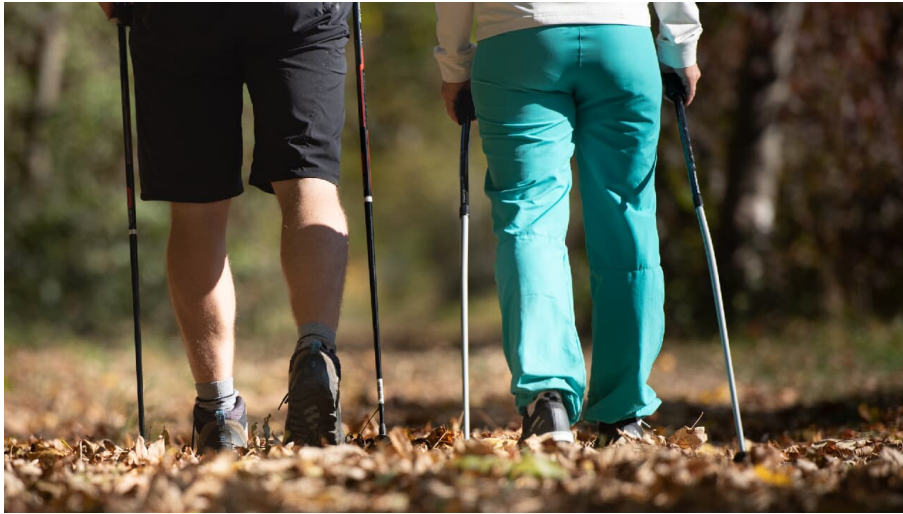
Nordic Walking