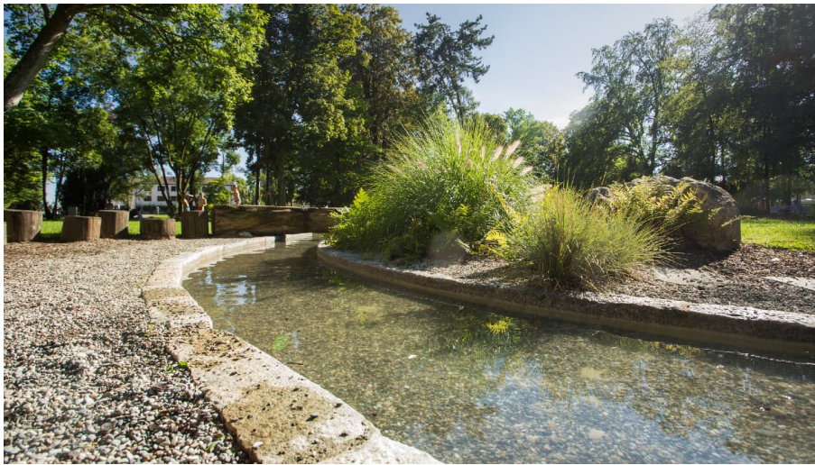
Kneipp-Wasser-Wohlfühlpfad Taxispark Dillingen