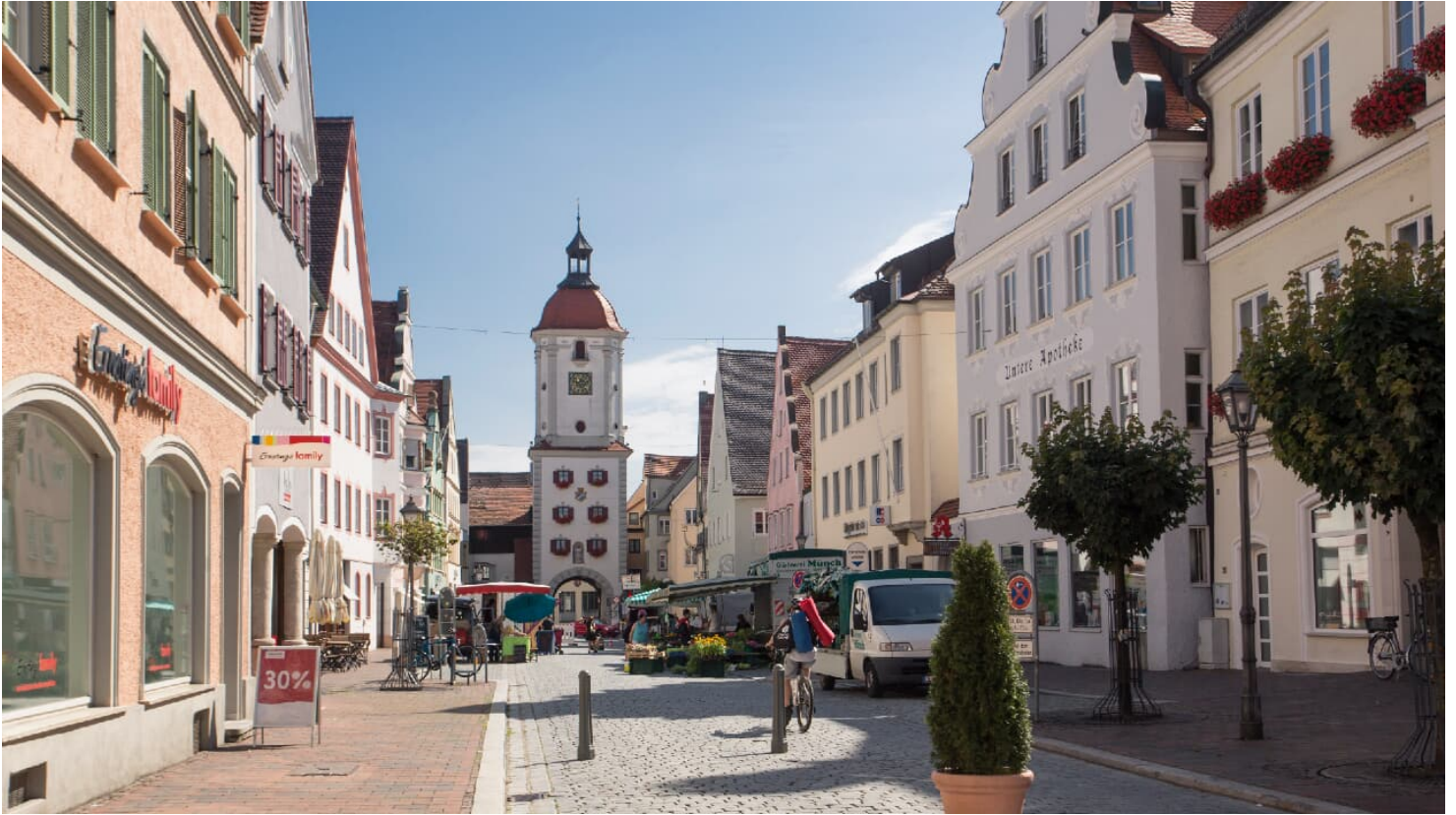
Altstadt Dillingen