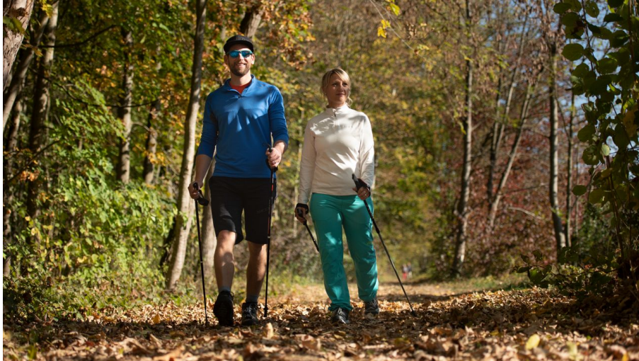
Nordic Walking