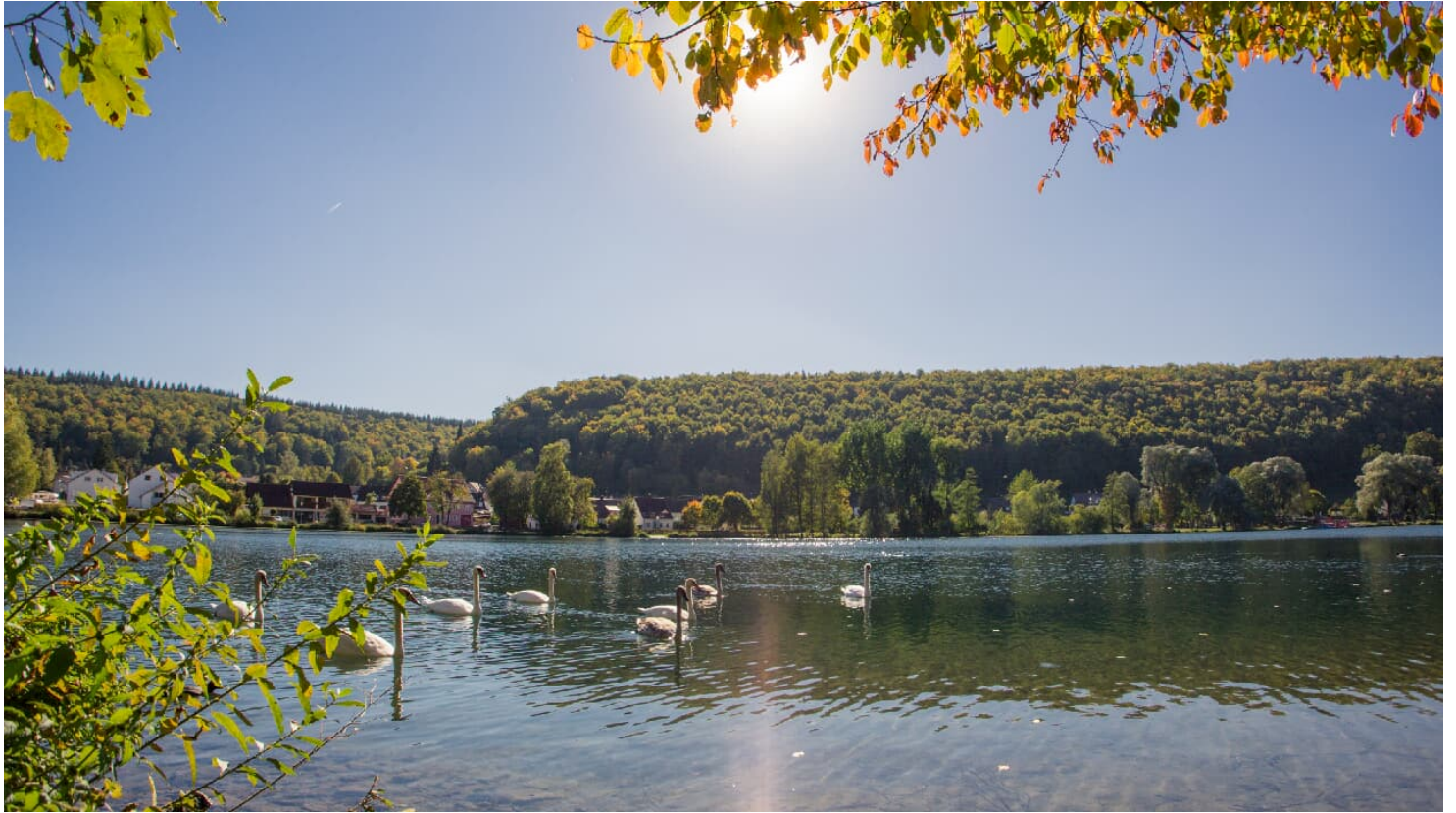
Itzelberger See - © Fouad Vollmer Werbeagentur