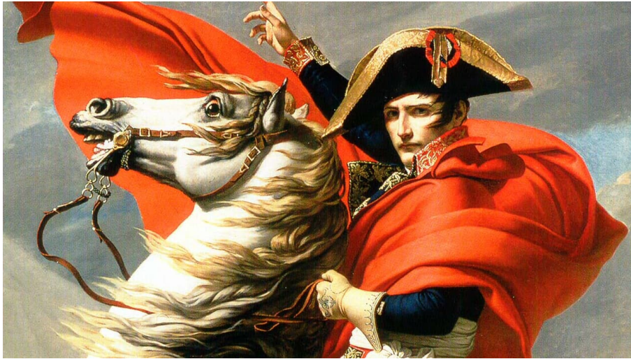
Napoleon in Günzburg