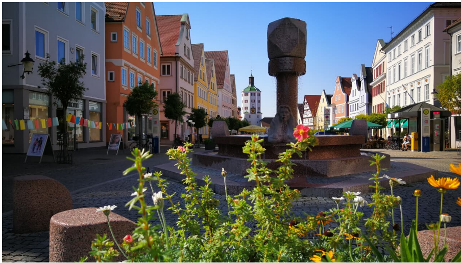
Klassischer Stadtrundgang durch Günzburg