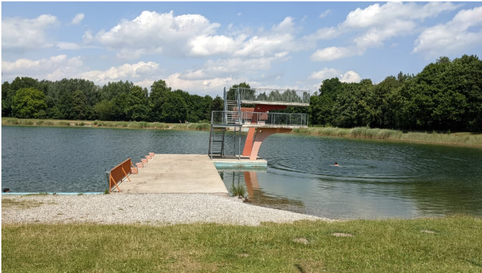
Sprungturm am Gartnersee