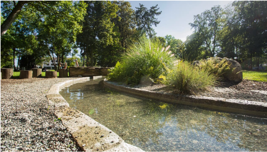
Kneipp-Wasser-Wohlfühlpfad im Dillinger Taxispark