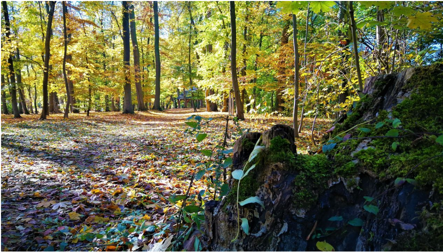
Städtische Anlagen Bürgerpark Günzburg