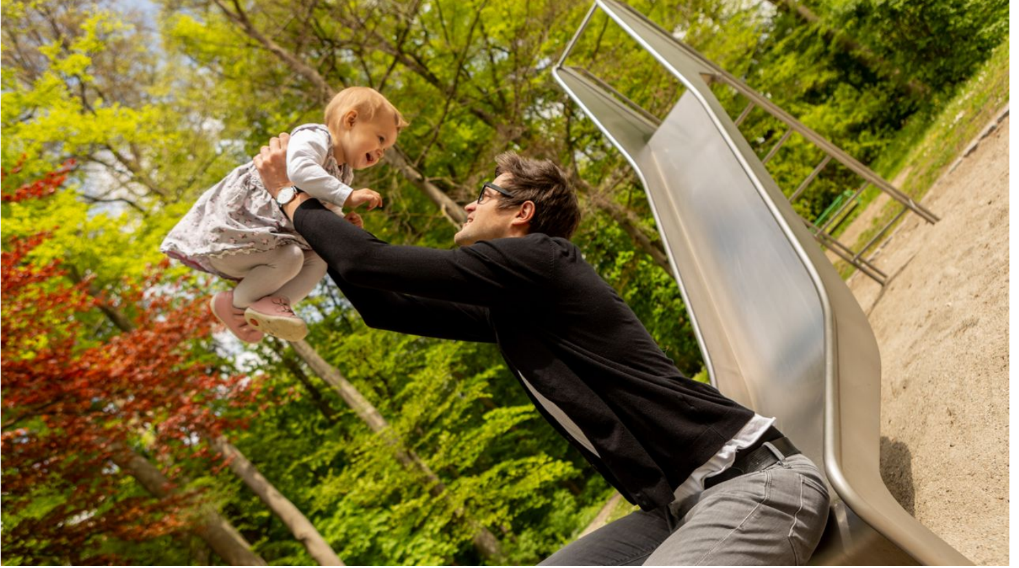
Spielplatz Bürgerpark Günzburg