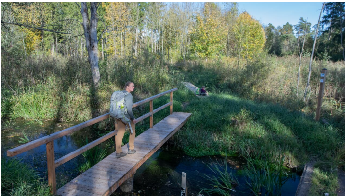
Altarm kurz nach Offingen