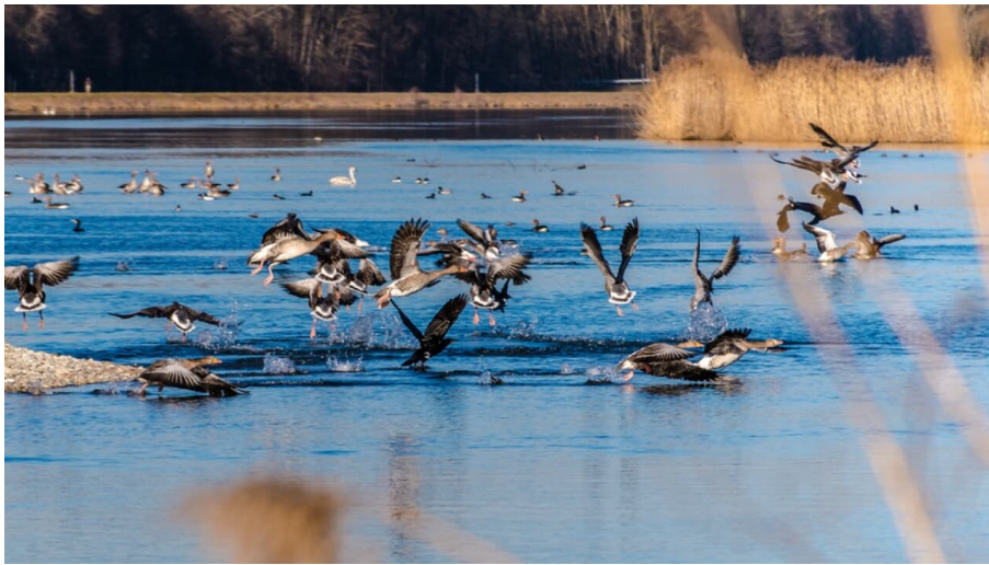
Faiminger Stausee bei Lauingen