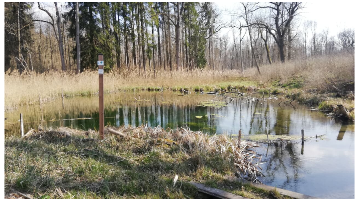
Altarm nach Offingen