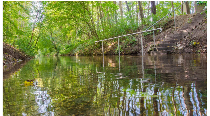
Naturkneipanlage in der Donau bei Dillingen