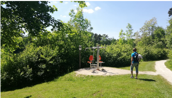
Trimm-dich-Pfad Dillingen