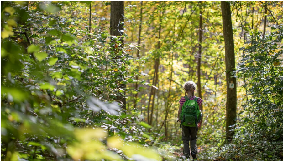
Im Auwald bei Dillingen