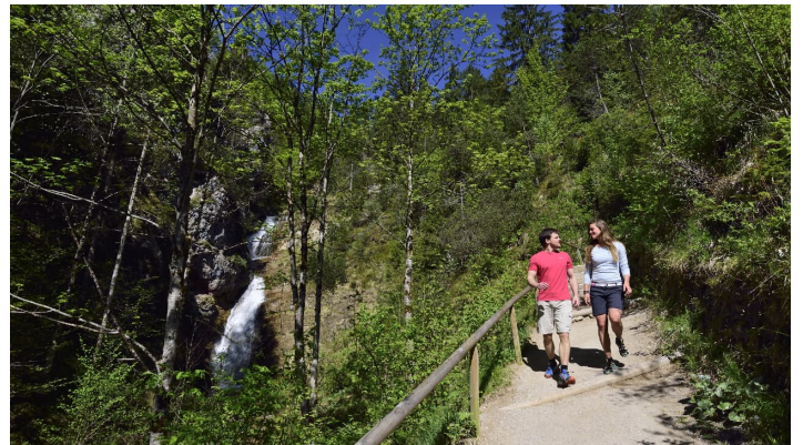
Laintal Wanderung - © Alpenwelt Karwendel | Stefan Eisend