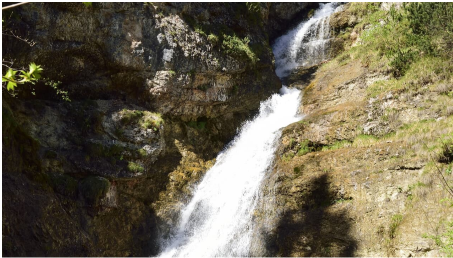
Laintal Wasserfall