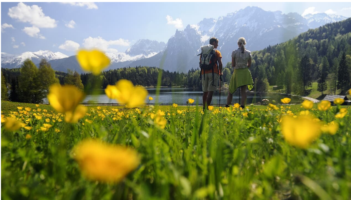
Paar wandert am Lautersee