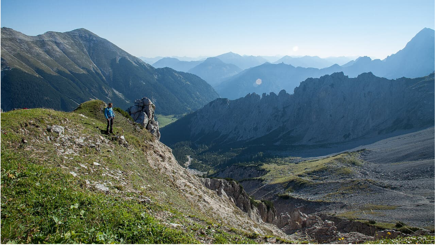
Wörnersattel - © Alpenwelt Karwendel | Hubert Hornsteiner