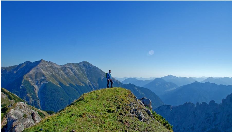
Bergtour Wörnersattel und Hochlandhütte