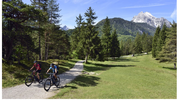
Um den Kranzberg - © Alpenwelt Karwendel | Stefan Eisend