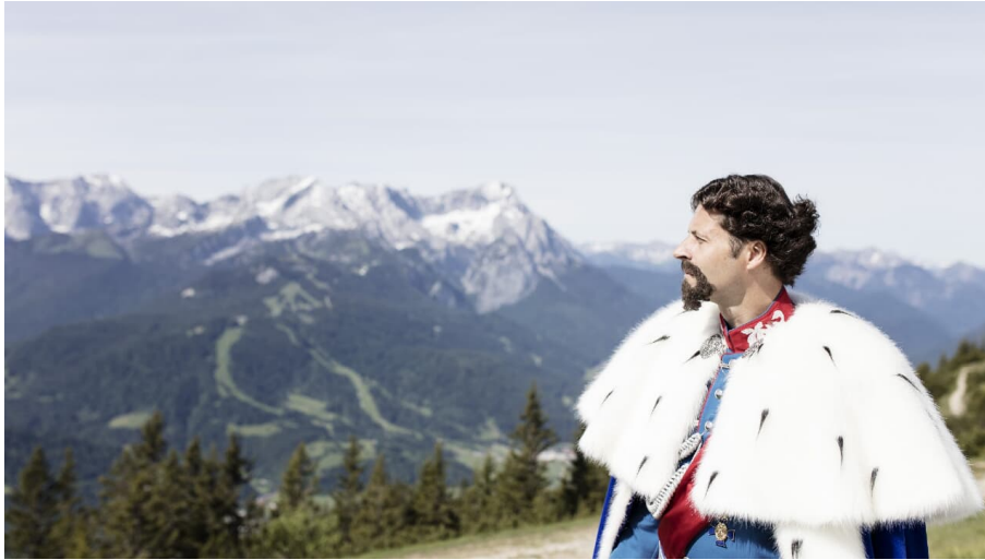
Der Kini am Berg