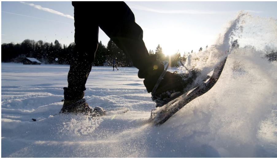
Schneeschuhwanderung in der Alpenwelt Karwendel