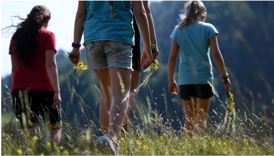
Familienwanderung in Wallgau