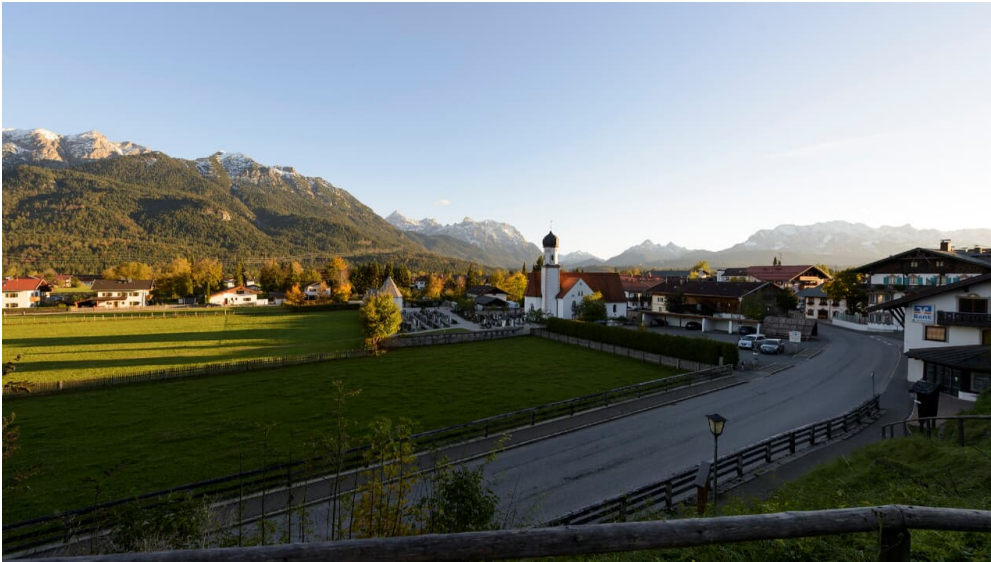
Ortsansicht von der Wallgauer Sonnleiten