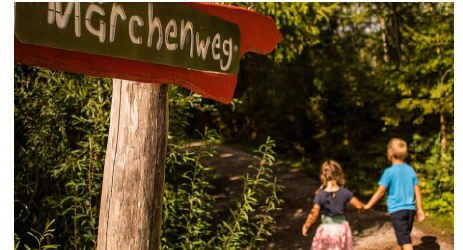
Start zum Märgchenweg bei Wallgau