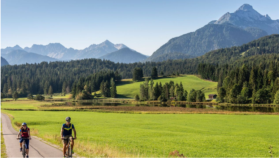
Radtour vorbei am Schmalensee