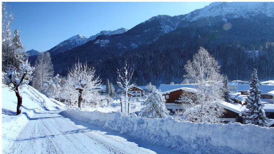
winterliche Ortsansicht von Krün - © Alpenwelt Karwendel | Christoph Schober