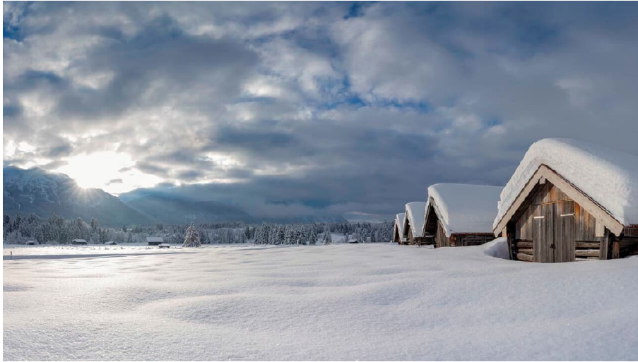
Winterlandschaft bei Krün in Bayern