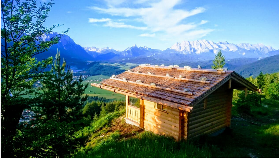
Unterstand am Krepelschroffen