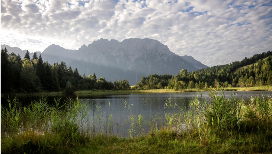
Luttensee mit Panoramablick