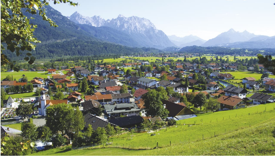
Wallgau Panorama - © Alpenwelt Karwendel | Hubert Hornsteiner