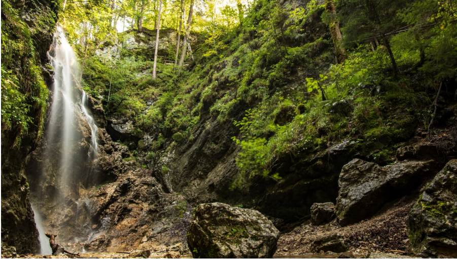
Kleiner Wasserfall in Wallgau