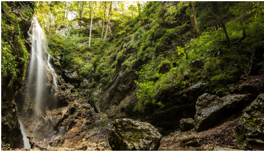
Kleiner Wasserfall in Wallgau