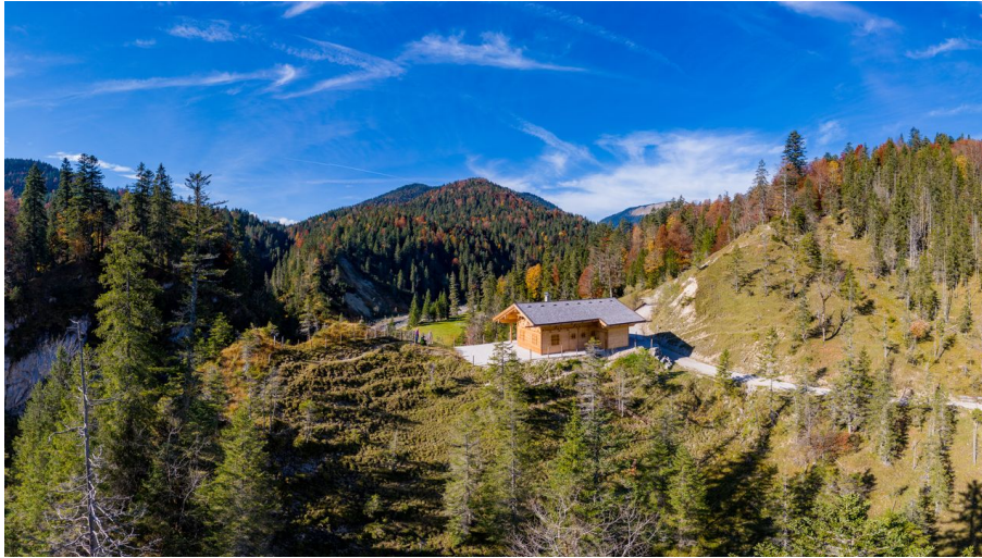
Finzalm im Estergebirge