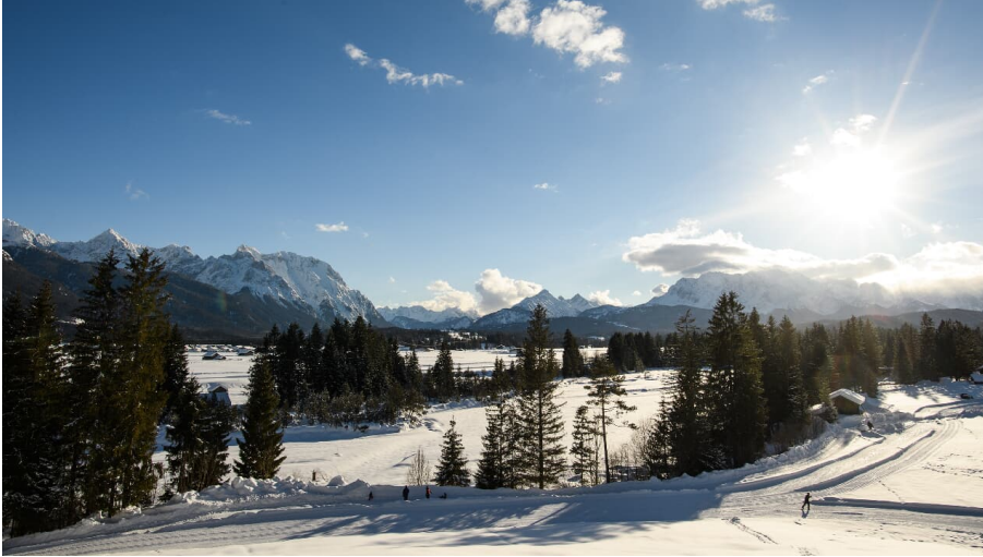
Panorama Wallgau Loipe - © Alpenwelt Karwendel | Philipp Gülland, PHILIPP GUELLAND