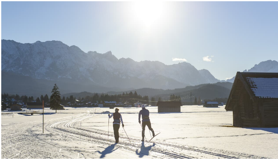
Langlauf zwischen Wallgau und Krün