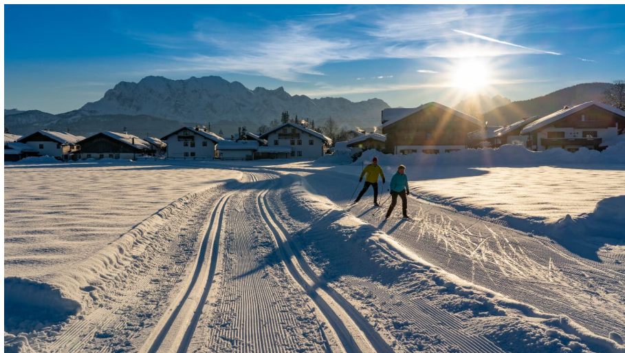
Langläufer an der Isarfeldloipe in Wallgau