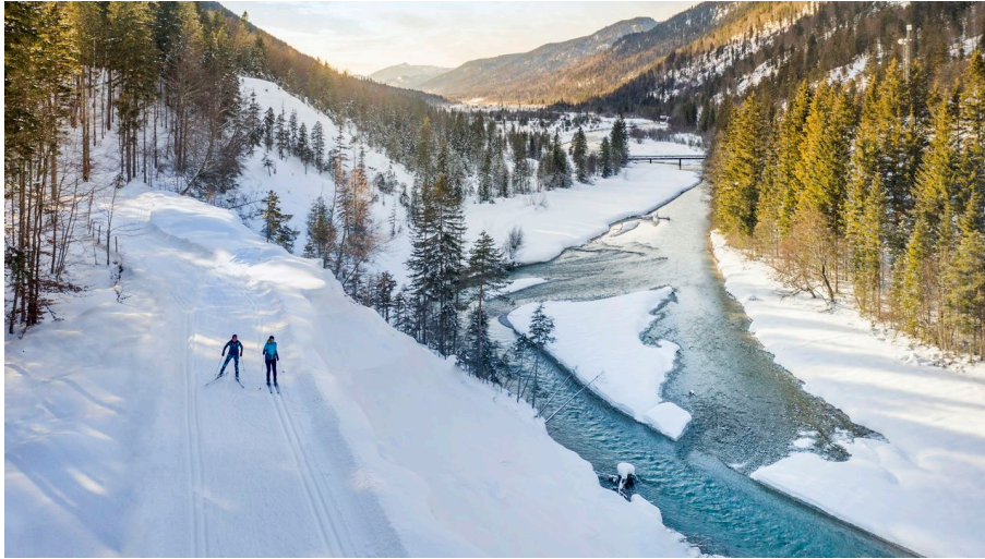
Langlaufen auf der Kanadaloipe