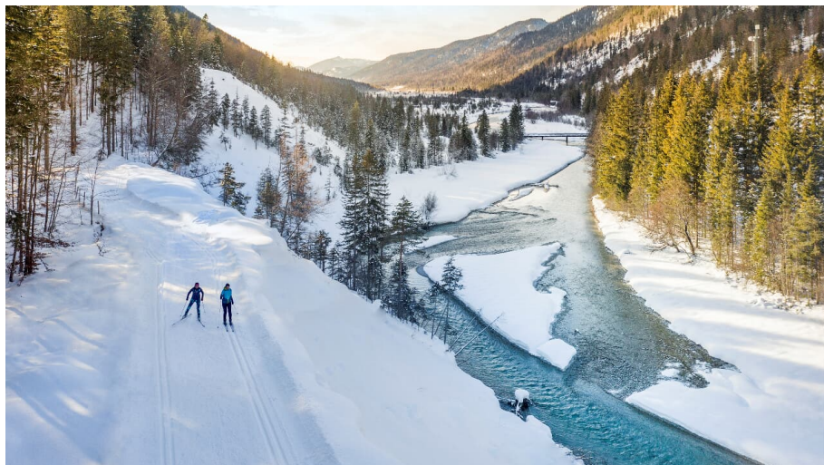
Langlaufen auf der Kanadaloipe