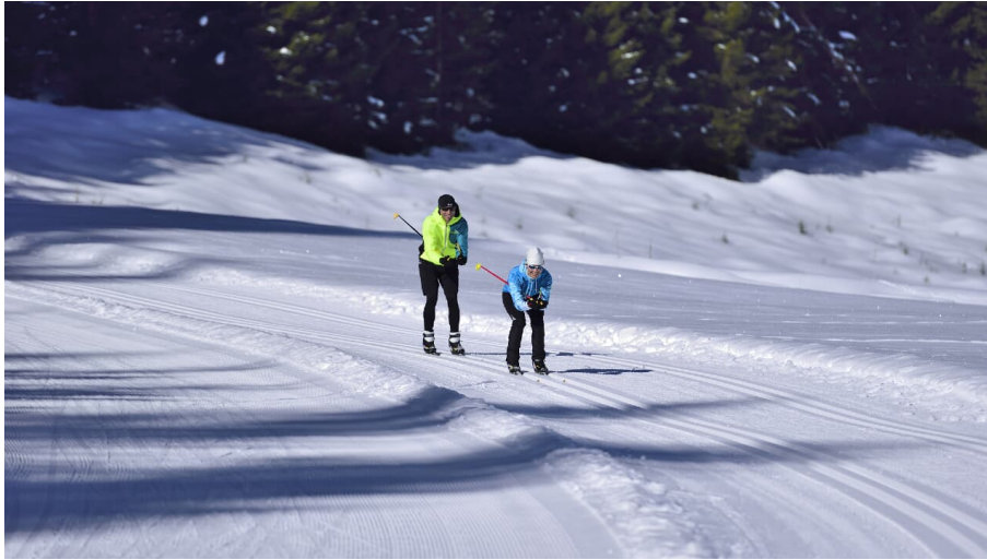
Langlaufen auf der Hofgartenloipe