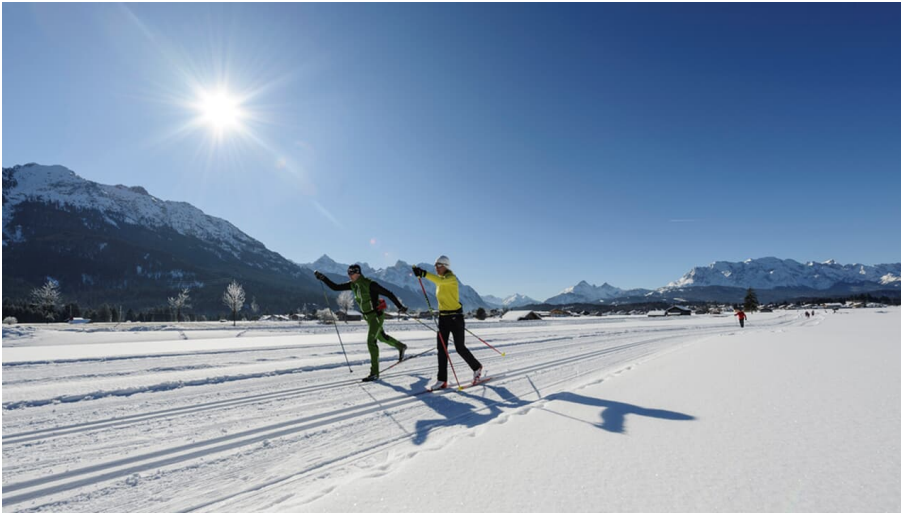
Langlaufen auf der Sonnenloipe in Wallgau