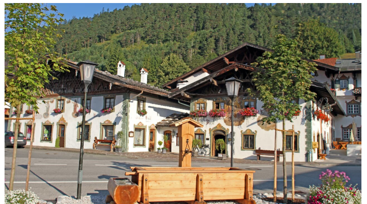
Wallgauer Dorfplatz