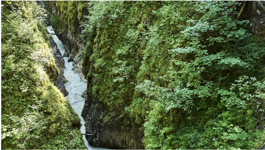
Leustascher Geisterklamm bei Mittenwald