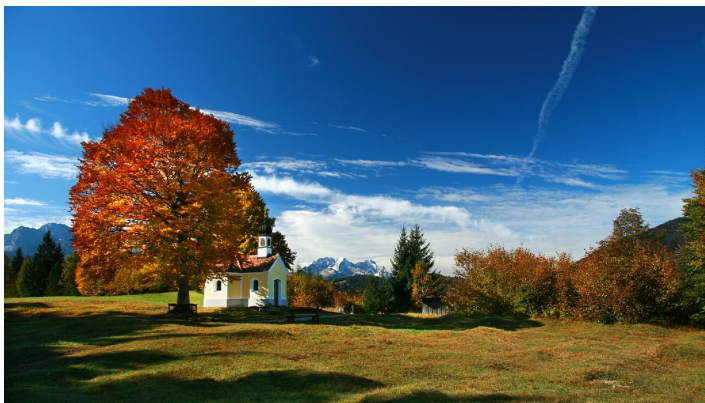
Kapelle Maria Rast auf den Buckelwiesen