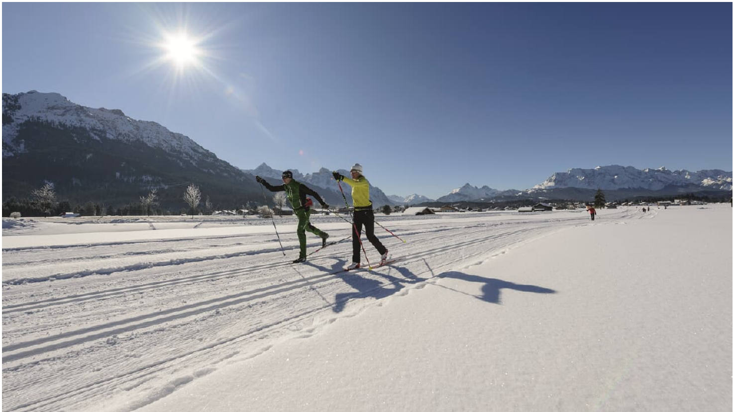
Loipe zwischen Wallgau und Krün