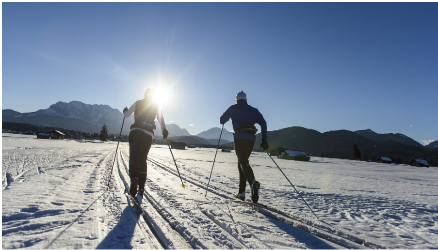
Langlauf Krün - Wallgau