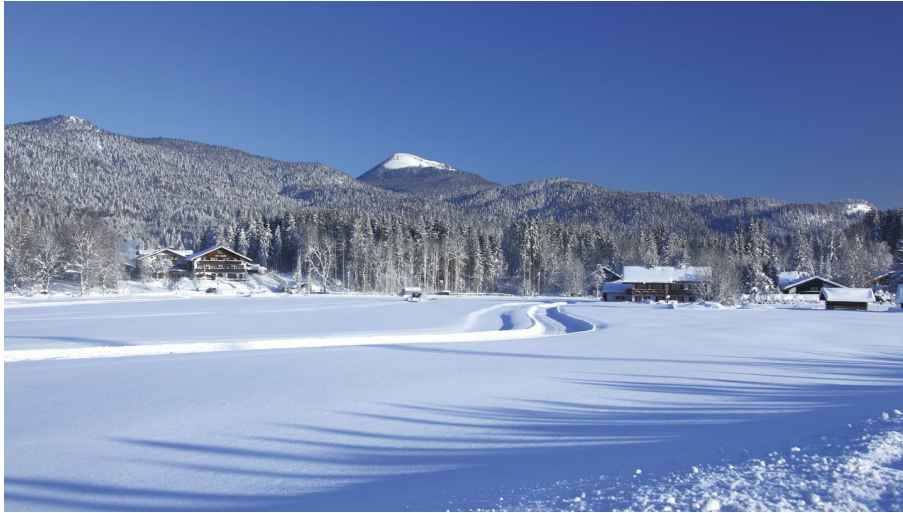
Panoramaloipe bei Krün